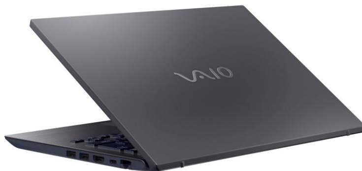
VAIO Pro BK

こうした背景のもと、DX 推進施策として、『1 人 1 台のモバイルノート PC』体制による業務効率化を目指し、約 700 台の VAIO を導入いただきました。2025 年 10 月から段階的に VAIO® Pro BK の導入をスタートし、2026 年 1 月には全職員への配布が完了しました。製品選定においては、VAIO の堅牢性と大容量バッテリー、そして顔認証や指紋認証といったセキュリティ機能が重視されました。さらに、日々の持ち運びを前提としたサイズと軽さを高く評価いただいています。