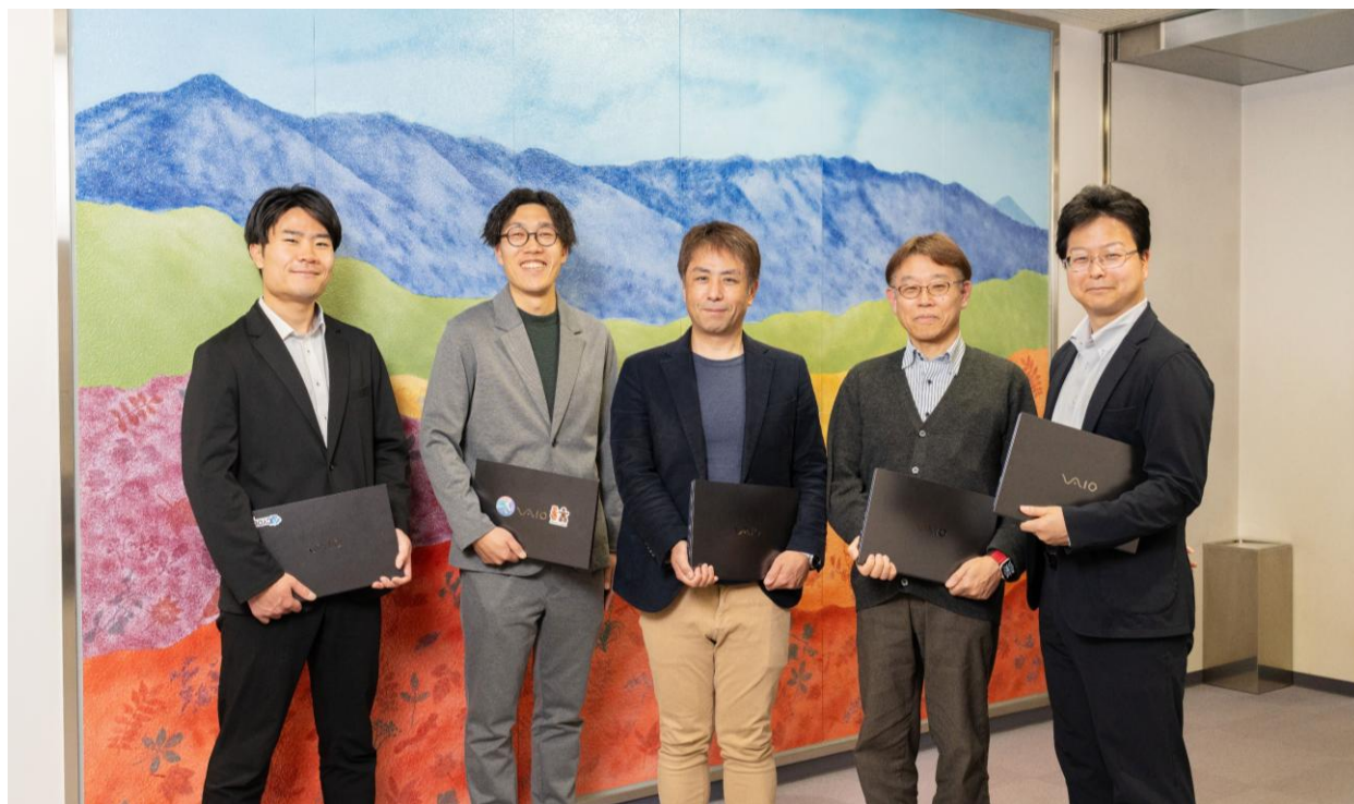
茅野市役所 企画部 DX推進課のみなさま

PC選定において高く評価されたのが、VAIOの堅牢性と大容量バッテリー、そして顔認証や指紋認証といったセキュリティ機能です。VAIOは国内に開発・製造・サポート機能が集約されていることで、万一の際にも迅速な対応が可能である点も評価いただきました。