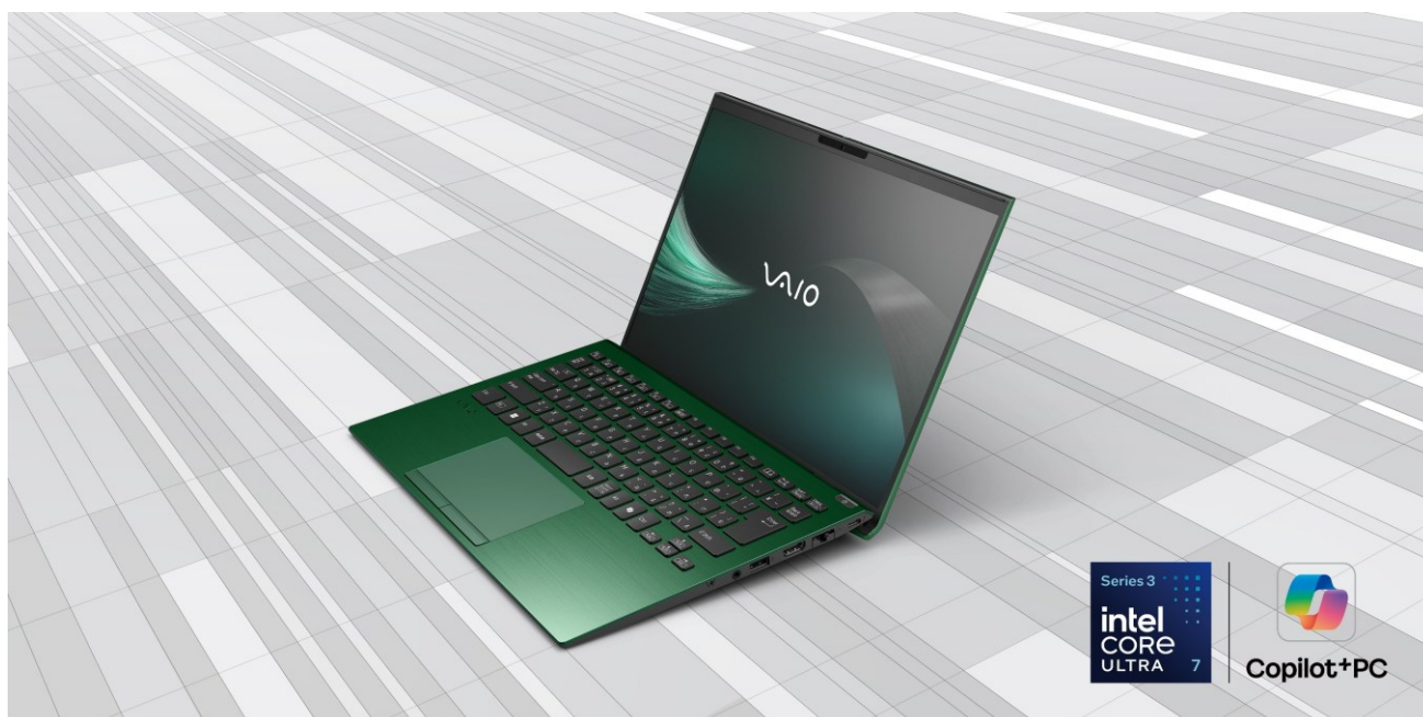
個人向け「VAIO® SX14-R」、法人向け「VAIO® Pro PK-R」（カラー：ディープエメラルド）

VAIO株式会社（本社：長野県安曇野市、代表取締役社長：糸岡健、以下VAIO）は、VAIO初となる、最新世代のインテル® Core™ Ultra シリーズ 3 プロセッサを搭載した「Copilot+ PC」、VAIO最上位モデル 個人向け「VAIO® SX14-R」、法人向け「VAIO® Pro PK-R」の新モデルを発表いたします。