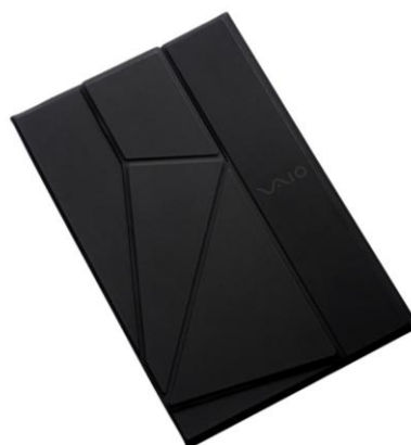
VAIO Vision+ ® 14/14P 専用カバースタンド