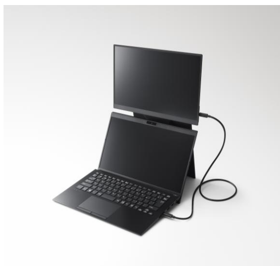
上下二画面設置時