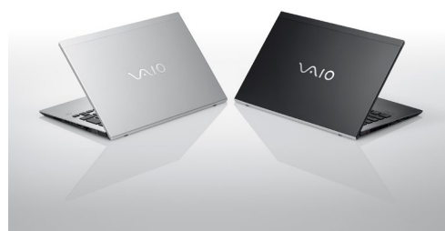
13.3 型ワイド「VAIO® Pro PG」 (写真左からシルバー・ブラック)

この度、前モデルと比較して約 1.7 倍の最大連続約 22.2 時間駆動*1 へと、大幅にバッテリー性能が強化され、外出時に AC アダプターを持ち歩かなくても、いつでもどこでもより安心してご使用いただけるようになりました。