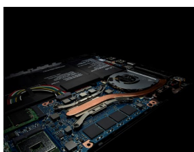
VAIO S11・VAIO S13 (2018 年発売モデル)