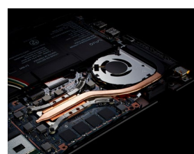
VAIO SX12・VAIO SX14 (2020 年モデル)