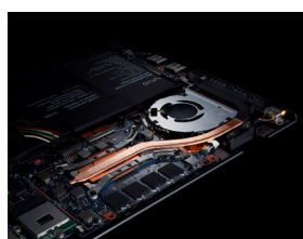
VAIO SX12・VAIO SX14 (2019 年モデル)