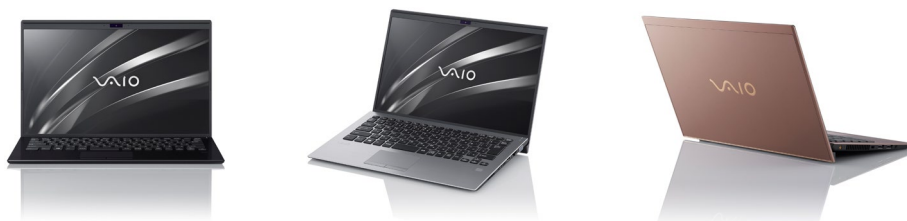
14.0型ワイド 大画面モバイルノート PC ＜個人向け＞「VAIO® SX14」 / ＜法人向け＞「VAIO® Pro PK」

2019年、設立5年目を迎えるVAIOは、モバイルPCの新たなスタンダードを提案する本モデルの発売を通じ、企業としても次のステージへ進む決意を新たに、引き続きものづくりと真摯に向き合い、VAIOの目指す「快」をあらゆるお客様にお届けしてまいります。