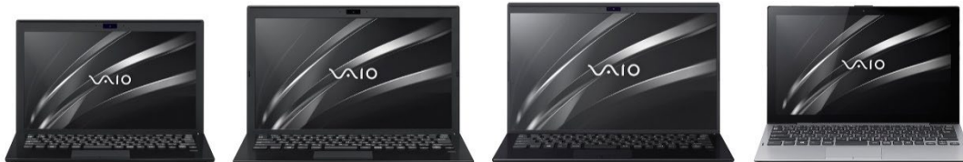
VAIO Pro PF (11.6 型ワイド)