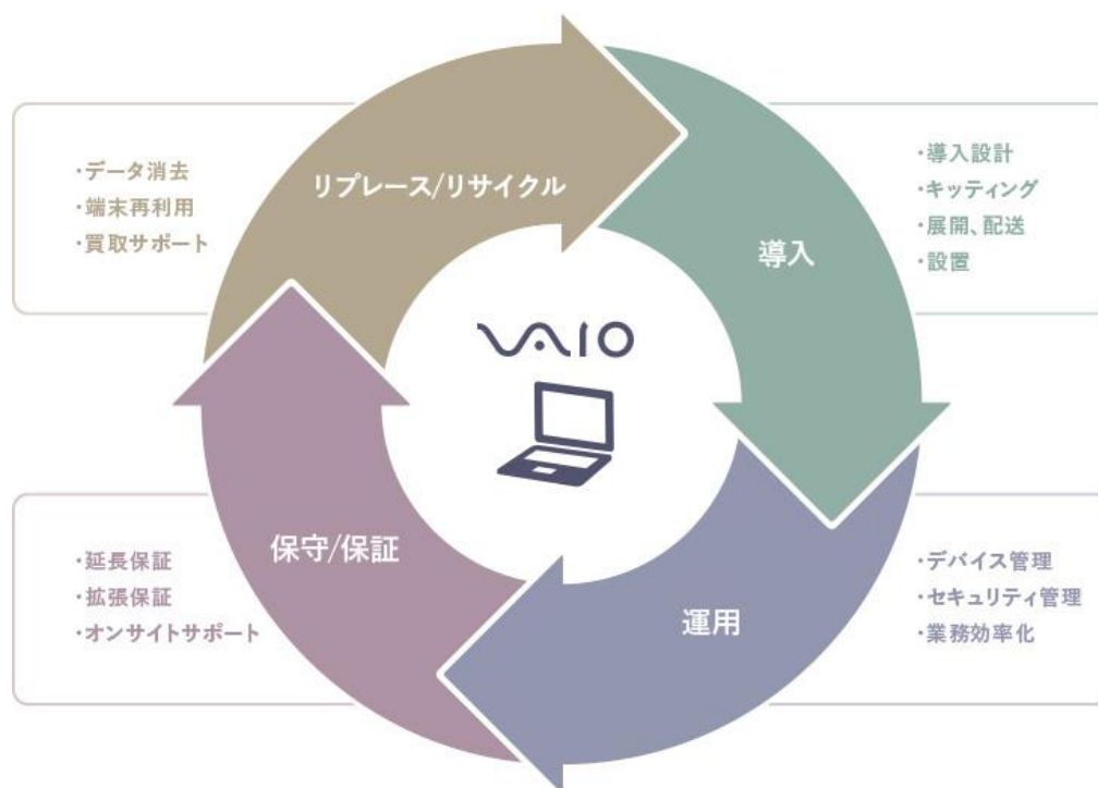
<VAIOの PC ソリューション概念図>