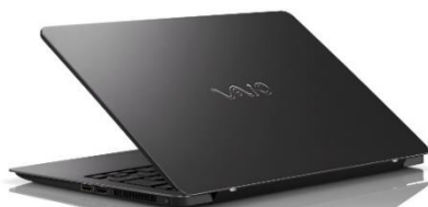
VAIO Z クラムシェルモデル