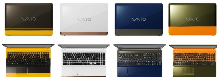
イエロー/ブラック ホワイト/銅 ネイビー/グレー オレンジ/カーキ