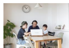
使用シーン イメージ

ご家族で使用することを想定し、必要十分な性能と拡張性、ストレスなく使いこなせる操作性を備えています。