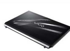
④ビュークローズモード

※キーボードユニットの入出力端子及びセカンドバッテリー機能は①ノート PC モードでのみ使用できます。 ※ワイヤレスキーボード機能搭載の場合、③及び⑤のモードでキーボードとタッチパッドが使用可能です。