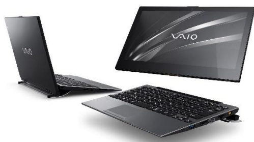
12.5 型ワイド 2 in 1 モバイルノート PC <個人向け> 「VAIO® A12」 <法人向け> 「VAIO® Pro PA」

尚、プレミアムエディションとして「黒」と「高性能」へのこだわりを追求した ALL BLACK EDITION がラインアップに含まれる他、「VAIO A12」「VAIO Pro PA」の利便性をより引き出していただけの各種拡張アクセサリも同時発売いたします。