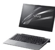
⑤ワイヤレスキーボードモード