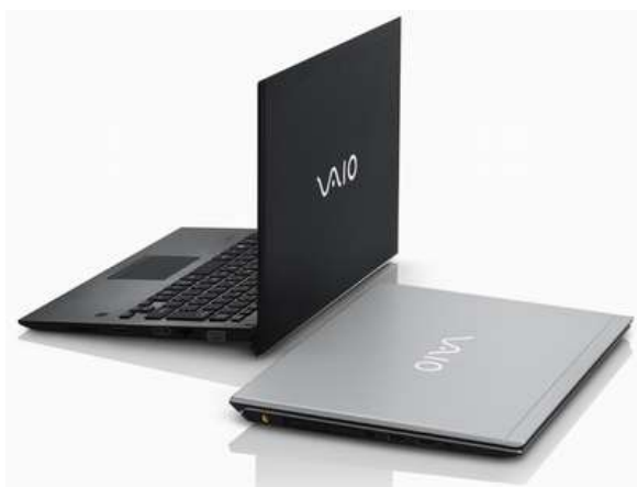
<VAIO S13/VAIO Pro PG>

この通信方式を Wi-Fi の代替としてオフィスでの無線ネットワーク構築に利用し VAIO PC と共に用いることで、LTE 技術によるセキュアで高品質な通信、カバーエリアの広い基地局を生かした低コストな広域ネットワークを実現いたします。