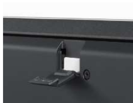
<認定を取得した LTE モジュールを内蔵>

なお、VAIO S11、VAIO Pro PF もこの通信方式に対応した同モジュールを搭載しており、これら 2 モデルにつきましても認定取得に向けて検討を進めております。