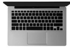
シルバー・無刻印キーボード