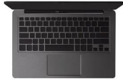
ブラック・無刻印キーボード