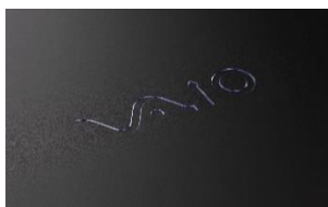
ブラック・勝色ダブルアルマイト仕様